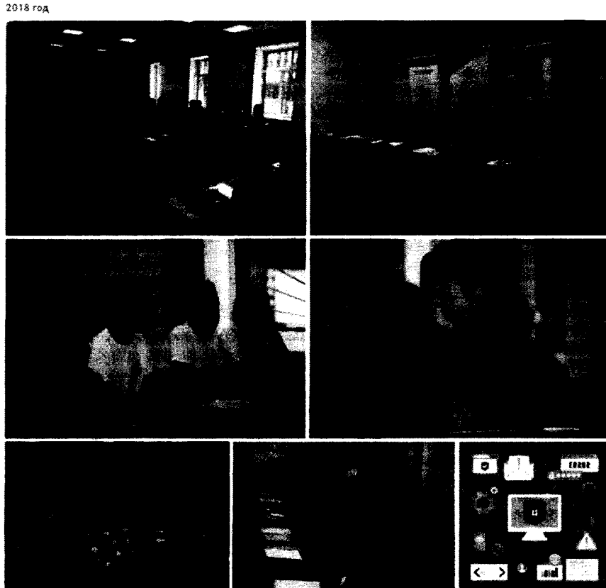
Рисунок 6 – Фоторепортаж открытия первого потока обучения в официальной группе движения "Интернет без угроз" " vk.com/internetithouthreats "

5. Заключительный пресс-релиз с комментариями участников – размещается в день завершения мероприятия или на следующий день.